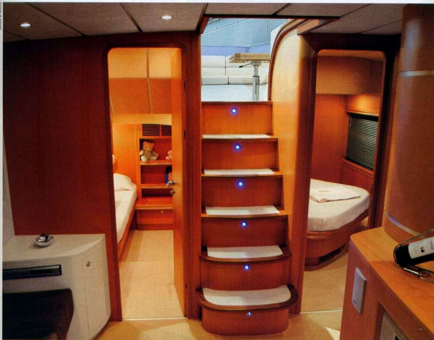
MANAGER A. MANGI

"The deep-V bottom," explains Tagliavini, "was designed to take both easy-going engines, such as the two 440 hp Yanmars for the Turkish market, as well as the more powerful two 730 hp Mans or the two 700 hp Mans with Arneson drives. In all cases, the hull maintains optimal trim, reaching speeds of 33, 38 and 46 knots. Its SCRIMP construction guarantees rigidity and robustness combined with a very lightweight hull." At 16.15 metres, the Numarine 52' is an open with straight, elegant lines. "These go very much against the current market trend for lots of curves and arches," stresses Spadolini. One of the big pluses of the new Numarine 52' is its big wide spaces which are made very cosy and welcoming by their modern furnishings which stop just short of being minimalist. The cockpit has a three-person sun pad aft over the tender garage (which